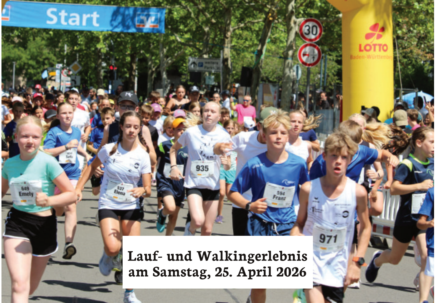
Lauf- und Walkingerlebnis am Samstag, 25. April 2026